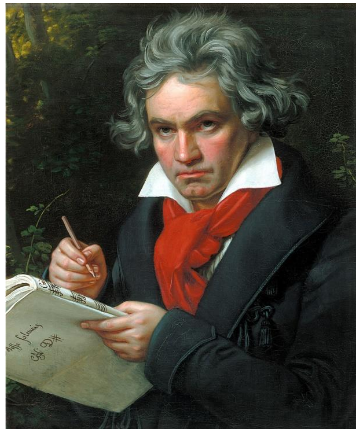
ルートヴィヒ・ヴァン・ベートーヴェン (Ludwig van Beethoven: 1770-1827)