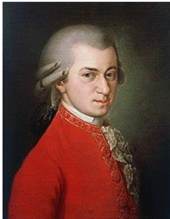
ヴォルフガング・アマデウス・モーツァルト (Wolfgang Amadeus Mozart: 1756-1791)